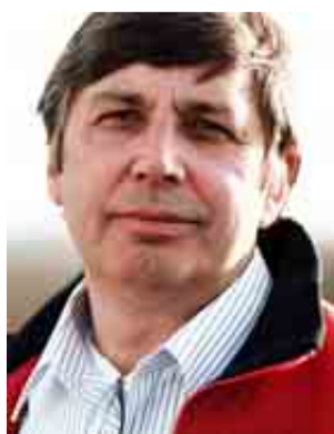
El físico Andre Geim.